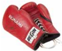
Guantoni da puglie