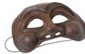
Maschera della Commedia dell'Arte