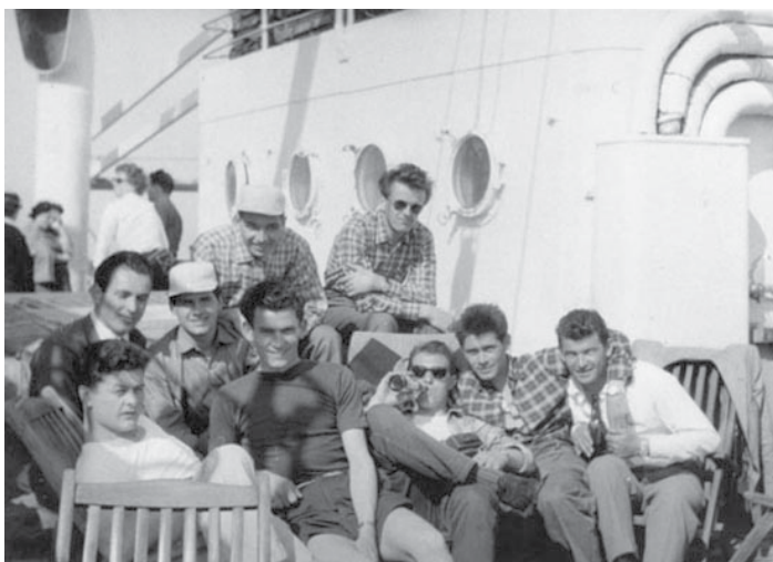
In viaggio verso l'Australia – maggio 1955

1. Quali suoni si sentono nell'audiovisivo e cosa suggeriscono?